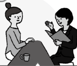
自分のプロフィールを考えてきてね

必要書類を持って結婚相談所に来所し、自分のプロフィールやお相手に望むことなどを登録しましょう。