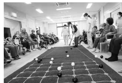
お楽しみのレクリエーション