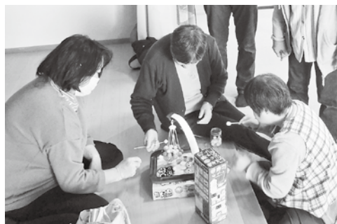
ドッキドキの「たまつむ」ゲーム

11月6日(土)、障がいをお持ちの方に働く場を提供する「就労継続支援B型事業所」では、作業所を利用する障がい者の皆さんの「お楽しみ会」が、高齢者福祉センターで開催されました。チャール周辺の散策や、室内でゲームをしたりお茶を楽しんだりしましたが、とりわけ吊ったお皿に玉を積み上げる「たまつむゲーム」では、玉を乗せるたびにハラハラドキドキ。球を置いた瞬間積んだ山がどつと崩れると本人を始めみんなで大爆笑。楽しい時間を過ごしました。