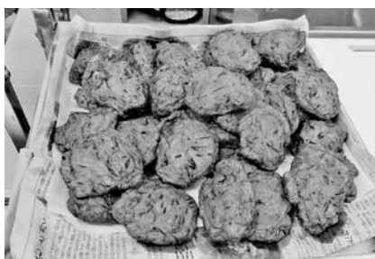
昼食には手作りのさつま揚げ