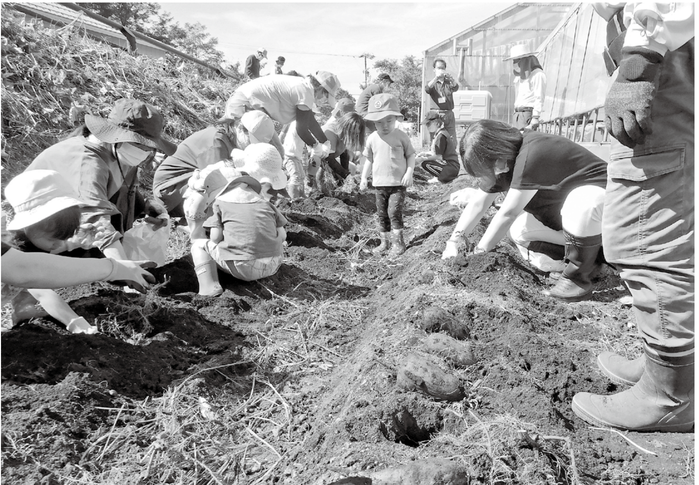
晴天の下、芋掘りを楽しむ親子とお手伝いするシルバー人材センターの皆さん

10月5日(火)、フラワーセン ター隣にある「さつまいも畑」で、 子育て支援センターを利用する 親子の皆さんと、シルバー人材 センター高山班の皆さんが、世 代間交流「さつまいも掘り」を行 いました。 朝からシルバー人材センター の皆さんは、長く伸びたさつまい もの蔓を刈り取り、ビニールマ ルチをはがして準備を整えてく りました。 この日参加した親子の皆さん は13組で、芋を掘り始めると大 中・小の様々な芋がどんどん出 てきました。普段は建物の中 でしか遊べない子どもたちは、 久々に外で体を動かせるとなつ て大喜び。芋掘りが終わった後 の畑では、腹ばいになって泳ぐ 真似をする子どもまで現れ、体 中土まみれとなつて遊んでいま した。