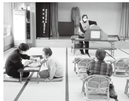
紙芝居の傍らでは健康相談も

買い物落ち着いた頃を見計らって、大広間では紙芝居が始まりました。この日は雷淹にちなんだ「雲から落ちた雷さま」と会津地方のお話で「どんとこい三途の川」の2つの出し物が