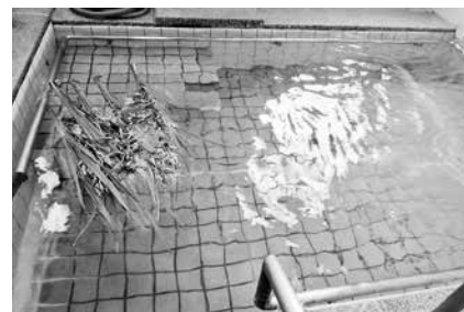
利用者様に好評の天然温泉