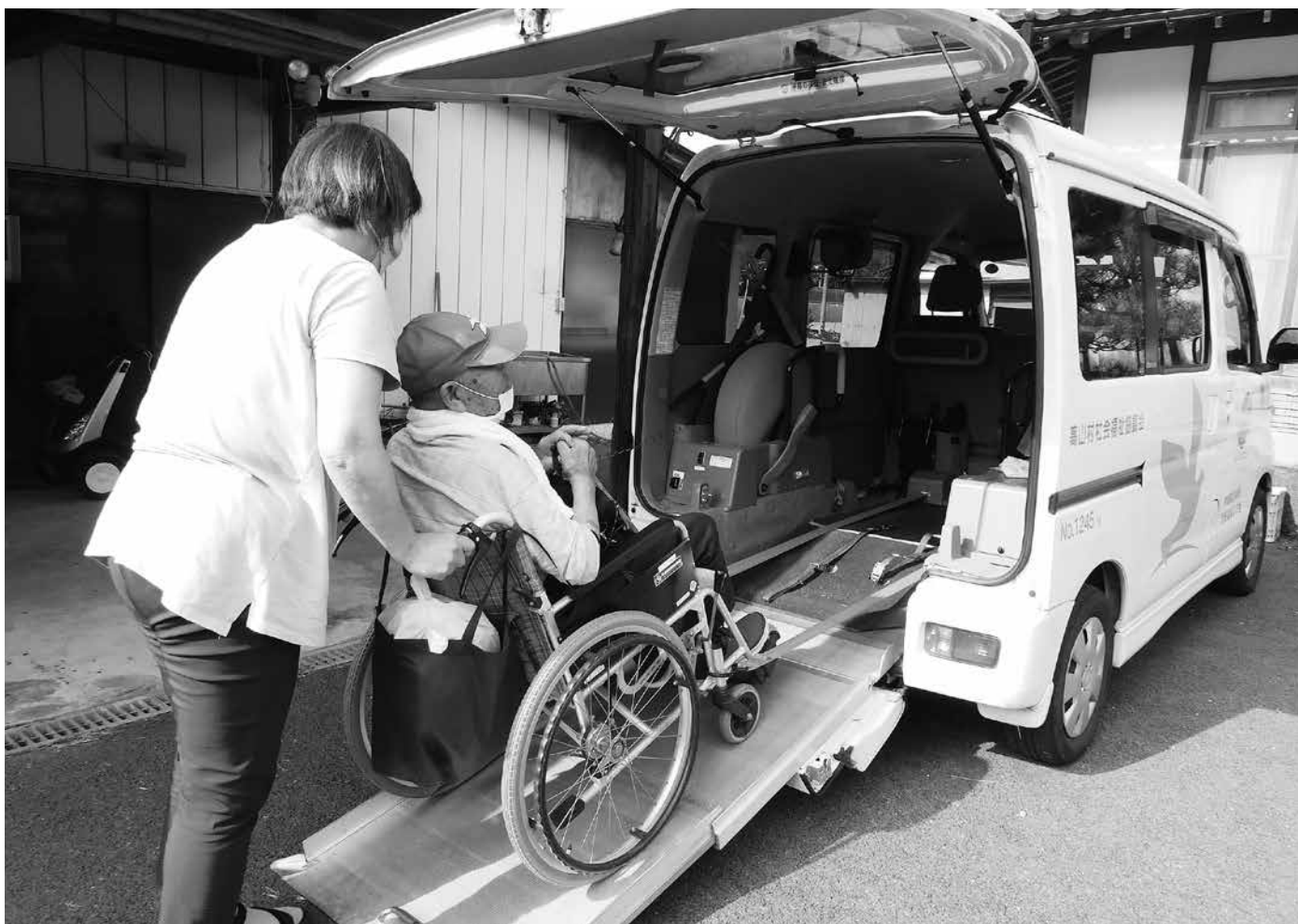
今日も病院から自宅まで安全にお連れしました