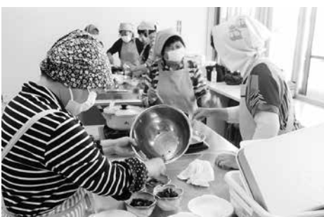
楽しさいっぱいの料理教室