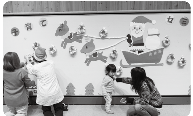
クリスマスリースの飾り付け

12月24日(木)、たかやま保育園と子育て支援センターにサンタクロースがやってきました。 最初に、たかやま保育園の0歳児から1歳児の乳児が待つひよこ組へ。一人ひとりにプレゼントと記念撮影をした後、2歳児以上の子どもたちが待つ遊戯室へ登場すると、子どもたちは大喜び。子どもたちから、「保育園に煙突がないのにどうやって入ったの」「好きな食べ物は何ですか」「サンタさんはどうやってなったの」など、サンタさんに質問攻め。プレゼントを一人ひとりに渡した後、クラスごとに記念撮影をした後、「来年も来るからね、元気でいてね」と約束して帰っていかれました。 次に訪れた子育て支援センターでは、ふれあいホールでクリスマスリースを作り、サンタさんの絵の周りに飾り付けを行いお出迎え。サンタさんとトナカイさんが登場すると、一人ひとりにプレゼントを渡しグループで記念撮影をして、「来年も来るね」と言っておトナカイと一緒に帰っていかれました。