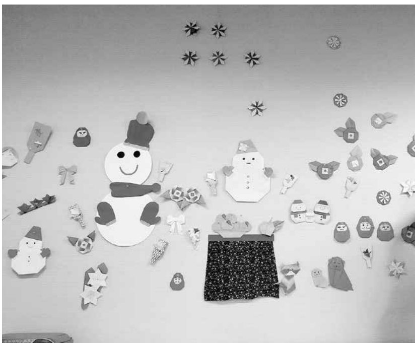
デイサービスセンターの壁に飾り付け

おりづるの会では、デイサービスセンター・あららぎクラブの利用者の皆さんの誕生日会にバースデーカードを制作していますが、バースデーカードだけでなく、他に何か出来ないかと皆で相談したところ、デイサービスセン