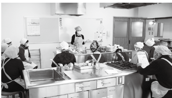
骨粗鬆症についての学習会

最初に、村健康福祉課の管理栄養士から、食事による予防・骨粗鬆症について説明がありました。骨粗鬆症は骨がもろくなる病気で、第1の予防は、毎日の生活が大変重要であり、特に骨をつくるカルシウムをいかにして摂取するかがポイントで、年齢とともに骨量は減少するが、その速度を少しでも遅くするため