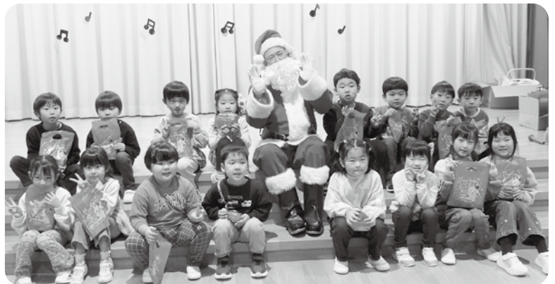
たかやま保育園でサンタさんと記念撮影