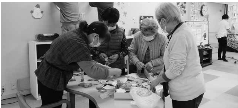
どの折り紙を飾ろうかね

12月26日(金)、おりづるの会の皆さん(会員8人・ボランティアグループ)により、デイサービスセンター日常動作訓練室の壁に季節の折り紙(雪だるま・だるま・羽子板)の飾り付けを行っていただきました。