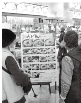
昼食なにしようかな

「昼食は、フードコートで好きなメニューを選んで注文し、デザートはマクドナルドのソフトクリームやサーティーワンアイスをいただきました。店内は余りにも広いので、移動するのが大変でしたが、休みながら店内をまわる事ができました。利用者の皆さんからは、「須坂にもこんなにたくさんの方がいるだね」「今度はいつ連れてきてもらえるのかな?」「広くて疲れる」「ここだけ都会みたいだね」などの声が聞かれました。