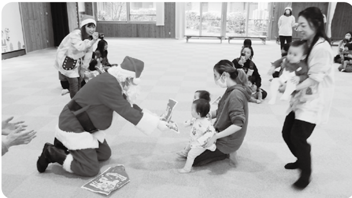
はい！サンタさんからプレゼント