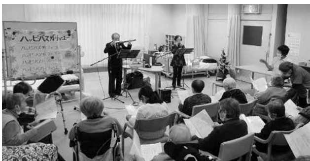
ハーモニカを演奏するシユガーズ

当日は、ボランティアの「シユガーズ」の皆さんによるハーモニカの演奏を披露していただき、なじみの曲に合わせて口ずさんだり、手拍子をしたりと、思い思いに演奏を楽しんでいただきました。「シユガーズ」の皆さん、ご協力いただきありがとうございました。