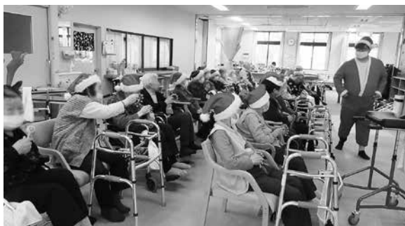
サンタさんと歌を楽しむ利用者の皆さん

おやつは、シヨートケーキ、モンブラン、ミルクレープ、飲み物はコーヒーや紅茶など、好みの飲み物を日替わりで楽しんでいただきました。また、レクリエーションの時間には、職員がサンタクロースに変装して登場すると、一気に笑顔と拍手に包まれ、利用者の皆さんからは、「似合ってる!」「楽しいね」などの喜びの声が聞かれました。利用者の方々にとって、笑顔あふれる素敵なクリスマス会となりました。