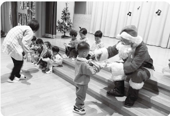
サンタさんプレゼントありがとう