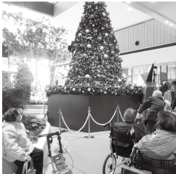
大きいツリーにビックリ!