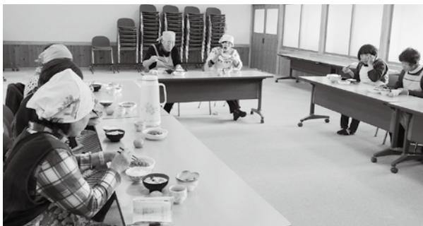
完成した料理を試食する参加者

あららぎクラブでは、12月5日(金)・8日(月)・9日(火)・11日(木)・17日(水)の5日間、利用者の皆さんはイオンモール須坂へ外出レクリエーションに行ってきました。オープン前から、「近くに出来たんだから一度は行ってみたいね」「バスで行ってみようかな」など、注目度の高い場所でした。午前中は通常のプログラム(インストラクターによる機能訓練・季節の飾り作り)を実施し、昼食前にイオンモール須坂へ出掛けました。