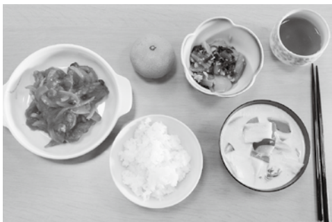
上手に出来ておいしそう

参加した皆さんからは、「鶏肉のトマト煮は、塩こしょうが少なかった」「チンゲン菜のツナ和えはとても美味しかった」「野菜のミルクスープにさつまいもを入れたのが良かった」「野菜のミルクスープは初めて食べた、クリームシチューより美味しい」などの声が聞かれました。