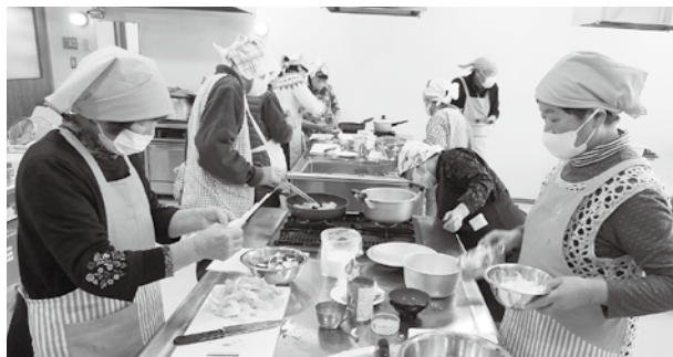
鶏肉のトマト煮に挑戦

に食生活を見直すことが大切で、1日のカルシウム摂取は600〜700mgが必要である等のお話をお聞きした後、食生活改善推進協議会の皆さんやシニアクラブ連合会女性委員の皆さんと一緒に、「鶏肉のトマト煮・チンゲン菜のツナ和え・野菜のミルクスープ」の3品に挑戦していただきました。