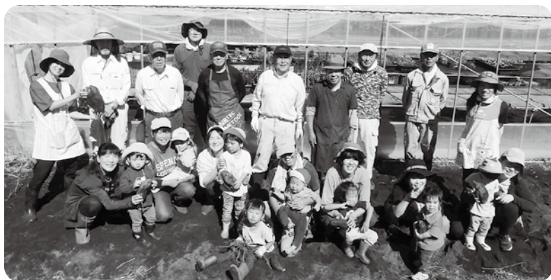
収穫後の記念撮影