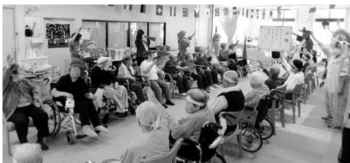
応援の掛け声で競技がスタート

競技は赤組と白組に分かれ、まず最初は海水浴で使用する浮き輪にロープを結び、浮き輪の真ん中にボールを入れ、ボールを落とさないよう気を付けながら、隣の人にロープを渡していく綱引きを行いました。利用者の皆さん