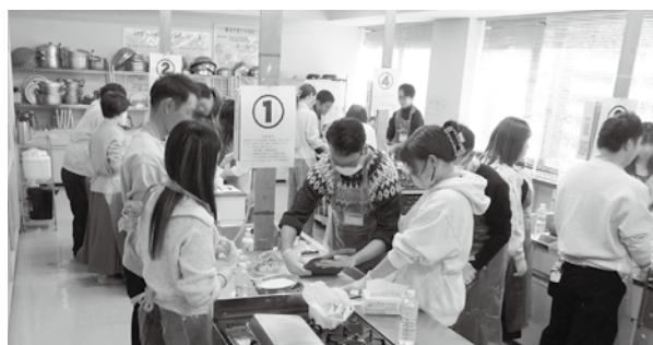
スイーツ作りに集中する参加者

参加者は、25歳〜34歳のグループ18名(男性9名・女性9名)と35歳〜45歳のグループ24名(男性12名・女性12名)に分かれて、それぞれの会場