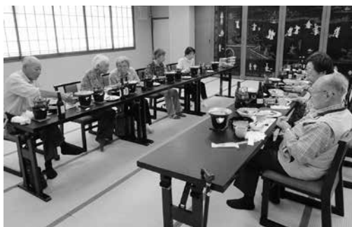
昼食を兼ねての交流会

千曲市上山田温泉ホテル圓山荘で温泉につかった後、昼食を兼ねての交流会ができた。思いに残る1日となりました。