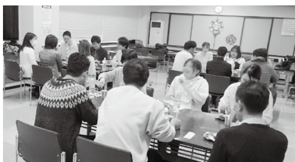
グループトークの様子

で自己紹介等を行った後、グループでスイーツ作りと彫金アクセサリー作りを行いました。