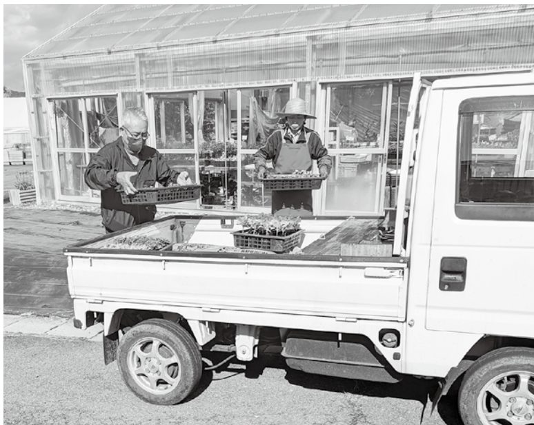
軽トラに積む花苗

また、フラワーセンターでは、パンジー、ビオラをはじめシクラメン等の花の販売を実施しています。皆さまの越しをお待ちしています。