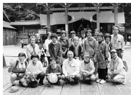
戸隠神社(中社)前で記念撮影

ることができました。高齢の独り暮らしでも、職員の方々、ボランティアの方々が寄り添ってくくださったおかげで、安心して参加できました。お世話になった皆さまに心より感謝申し上げます。