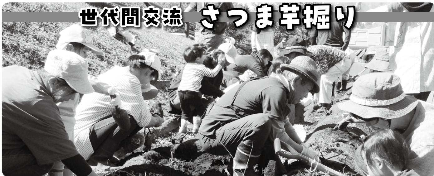
芋掘りを楽しむ親子とシルバー人材センターの皆さん