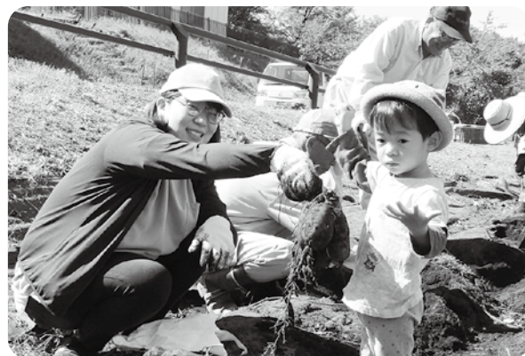
こんなに大きいお芋がとれたよ

10月8日(木)、フラワーセンター隣の「さつま芋畑」で、子育て支援センターを利用して親子8組17人の皆さんと、須高広域シルバー人材センター高山班8人の皆さんによる、世代間交流「さつま芋掘り」を行いました。 シルバー人材センター役員さんが、長く伸びたさつま芋のつるを刈り取り、黒マルチをはがしたところを、子どもたちが素手で、保護者の皆さんは、移植「テ」を使ってさつま芋を掘ると、大・中・小の様々な芋がどんどん出てきました。 保護者の皆さんからは「参加出来てよかった、芋を掘るより土を掘るほうが夢中になってしまった」「土に触れることができてよかった」「豊作で芋が大きくてビックリした、焼き芋、天ぷら、大学芋を作りたい」との声が聞かれました。 収穫したさつま芋は、袋にいっぱい詰めて持ち帰っていただきました。