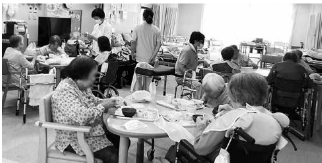
昼食を楽しむ利用者の皆さん