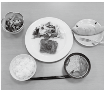
上手に出来ておいしそう