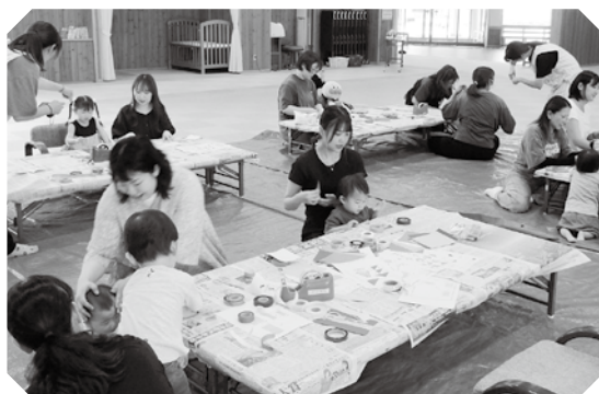
飾り付けを行う親子