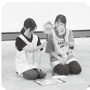
七夕の由来のお話