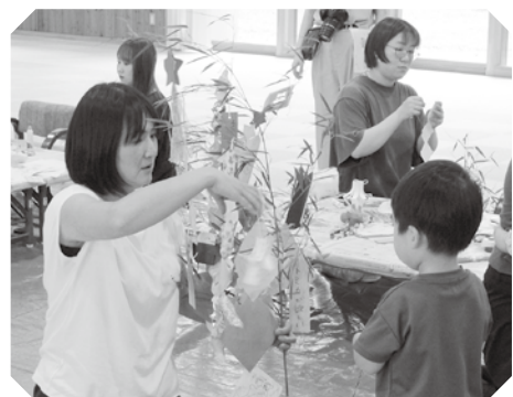
願い事を書いた短冊を笹に飾り付け

7月2日(水)、高山村社会福祉協議会では世代間交流事業として、更生保護女性会及びシニアクラブ連合会女性委員の皆さんのご協力をいただき、子育て支援センターを利用する親子の皆さんと「作って飾ろう！七夕さま」を開催しました。 最初に、子育て支援センター職員から、七夕の由来のお話を聞いた後、それぞれ4テーブルに分かれ七夕飾り作りを行いました。今年12組24人の親子が参加し、網飾り(天の川)や吹き流しなどを作り、願い事を書いた短冊とともに笹に飾り付けを行いました。 参加したお母さんからは「自分で色々やれたがる年齢になったので、絵を書いたりハサミを使ったり、大変いい経験ができました」「親子で七夕を作る機会がないので、貴重な体験ができました」、更生保護女性会の皆さんからは「お母さんに、飾り付けのアイデアが色々あって良かった」「子どもから手が放せないで、子どもの世話で七夕を作るのが大変そうでした」などの声が聞かれました。 最後に参加者の皆さんと記念撮影し、帰宅する際には、飾り付けした笹を持ち帰りました。