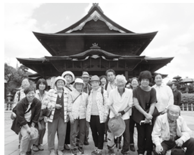
善光寺の前で記念撮影

普段は名前もお顔も知らない人と行動を共にして楽しい外出でした。道中はボランティアの方に付き添っていたり、安心して思い出作りの旅が出来ました。