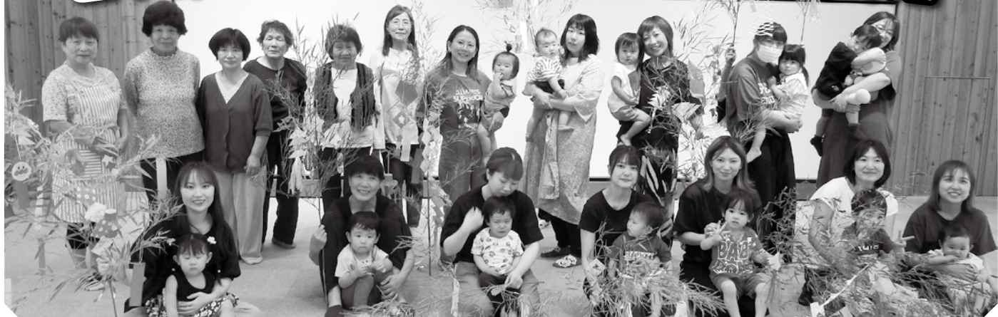
参加者全員の皆さんと記念撮影