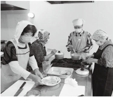
メカジキの片面パン粉焼きに挑戦

6月12日(水)、保健福祉総合センターで、独り暮らし高齢者の皆さんを対象にシルバークッキングを開催しました。