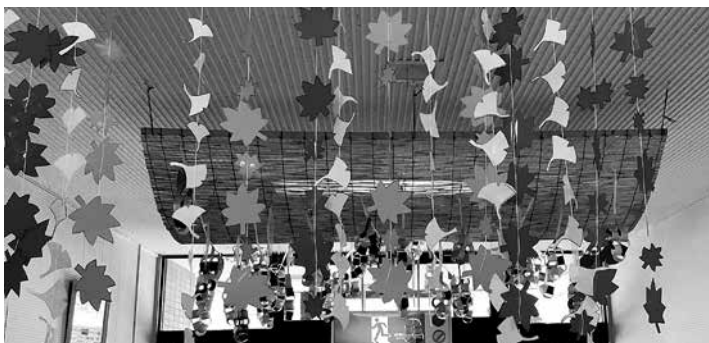
色紙で制作したもみじ・銀杏の葉