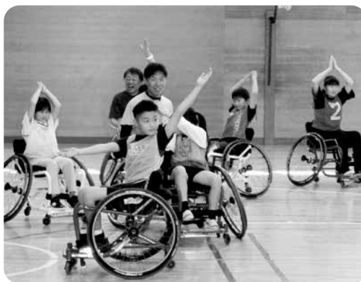
バナナ鬼競技に熱中