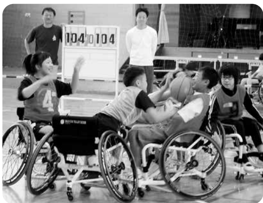
ポートボールに熱中