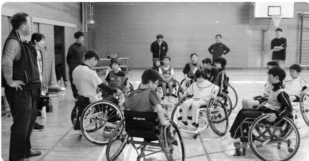
ポートボールのルール説明を聞く子どもたち

発行者 社会福祉法人 高山村社会福祉協議会 TEL 242-1220 FAX 242-1222 印刷所 (株) オフセット