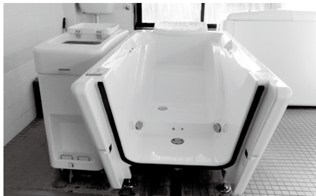
新しくなった特殊浴槽

浴槽の中で足が延ばせ、座浴の方も入浴が可能です。スタッフが入浴中の表情や体の状態を確認できるので、安心して入浴することができます。 利用者の皆さんから「とっても気持ち良くお風呂に入れて幸せ」との言葉をいただいています。これからも利用者の皆さんに満足いただける介護サービスを提供して参ります。