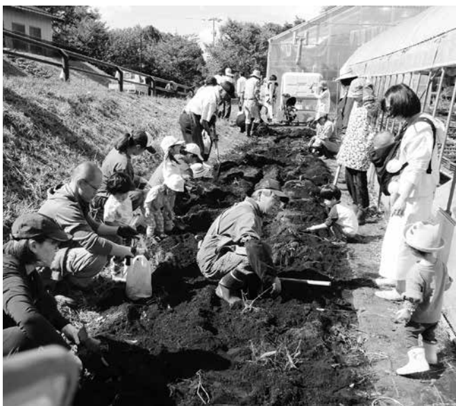
芋掘りを楽しむ親子とシルバー人材センターの皆さん