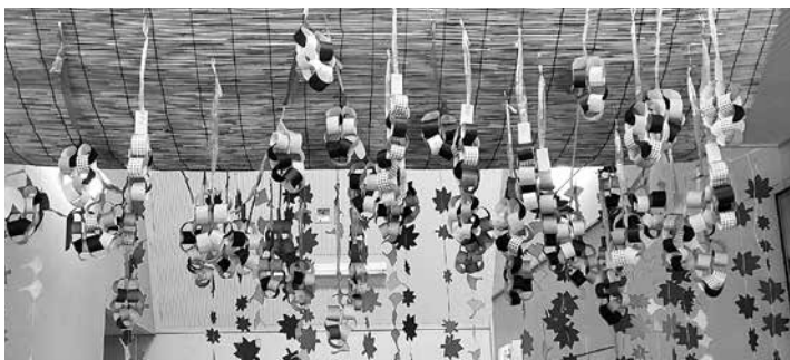
折り紙で制作したぶどう棚

デイサービスセンターの玄関入口にぶどう棚やもみじの葉を飾り付けると秋らしい雰囲気になり、利用者の方から、「綺麗に出