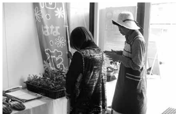
どの花にしようかな

10月26日(土)・27日(日)の2日間、高山村公民館・高山村役場庁舎2階・除雪センターで開催された「第28回高山村文化祭」にフラワースターも出店し花苗の販売を行いました。 就労継続支援B型事業所の皆さんと一緒に育てたピオラやパンジー、シクラメンなど季節の花を中心に花苗を販売し、文化祭に参加された大勢の皆さんに購入いただきました。