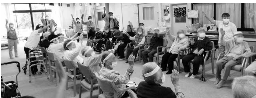
応援団長の掛け声で競技がスタート

10月16日(水)、18日(金)の2日間、デイサービスセンターではコロナ禍以降6年振りの運動会を開催しました。