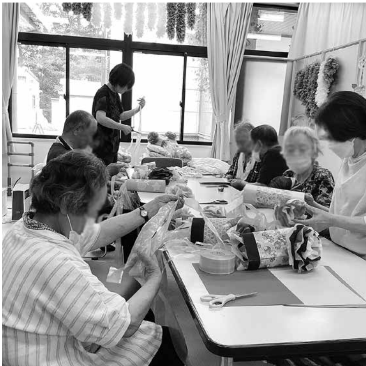
作品を制作するあららぎクラブ利用者の皆さん

7月19日(金)、デイサービスセンターとあららぎクラブの利用者の皆さんが、七夕飾りや吹き流しなどの作品に取り組まれました。 出来上がった作品は、デイサービスセンターの玄関やフロアに飾られ、利用者の皆さんからは、「綺麗に