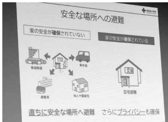
安全な場所への避難図

8月9日(金)、高山村保健福祉総合センターにおいて、高山村赤十字奉仕団研修会が開催され、奉仕団の皆さん(31名)が参加されました。 日本赤十字社長野県支部指導講師から、赤十字社の活動について学習した後、「屋内での安全対策」について、家具や家電などの転倒・落下・移動防止策を考え、自宅を見直す際の気付きや知識を学びました。地震によるけがの原因の46%が家具等の転倒落下、次いで29%がガラスによるけがで7割以上占めています。安全なスペースの確保のために、「転倒する家具は固定する。」「向きを変える、重いものは下に収納する。」「落下する・割れる家具は固定し、ガラス飛散防止フィルムを貼る。」「避難経路の確保では、「出入口や廊下に物を置かない、寝室、幼児・高齢者の部屋はなるべく家具を置かない」とのことです。 最後に「今日、帰ったときに、家具の向きを変更する、ルール(廊下にモノを置かない等)を家族と話し合っってほしい旨の呼びかけがありました。