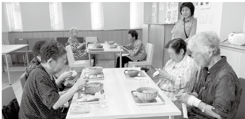
かまどカフェ小春日和での昼食

あらゆるぎクラブは、介護予防事業所として、楽しく、目的をもって、日々の体操などに取り組むきっかけになることを願っています。