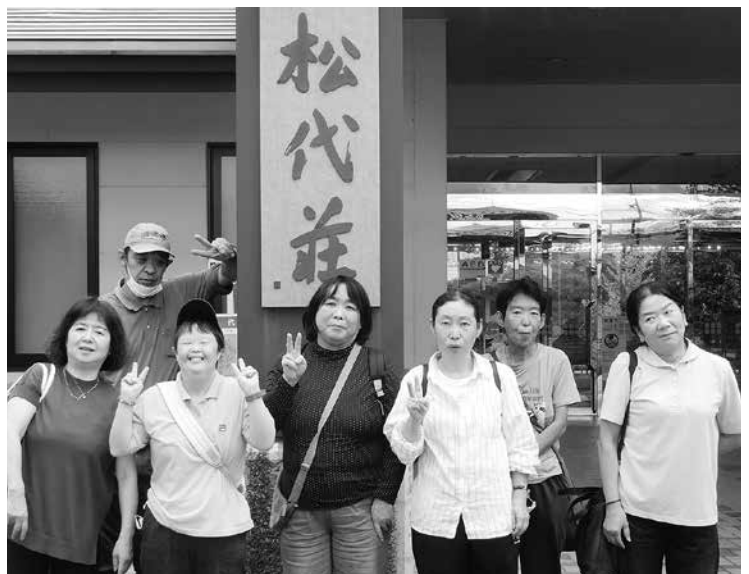
松代荘の前で記念撮影

9月21日(土)、「就労継続支援B型事業所」では、利用者の皆さん6名と職員で日帰り温泉「黄金の湯松代荘」と川中島の「おやきファーム」へ遠足に出掛けました。出発する前は曇り空で雨が心配でしたが、遠足には丁度いいお天気になりました。