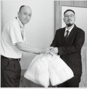
須高理容組合からタオルの寄付