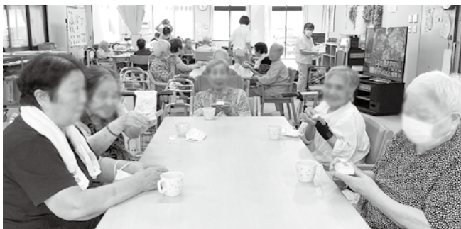
和菓子を味わう利用者の皆さん

利用者の皆さんからは、「おーきれいだ」「甘くておいしい」などの喜びの声がかれました。