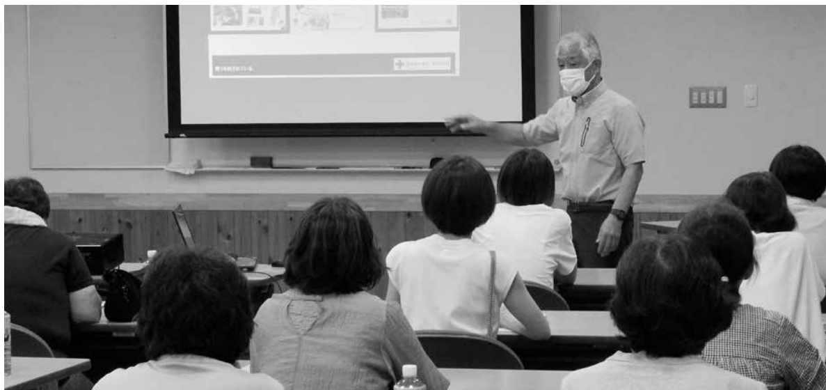
講師の話を熱心に聞き入る赤十字奉仕団の皆さん

発行者 社会福祉法人 高山村社会福祉協議会 TEL 242-1220 FAX 242-1222 印刷所 (株) オフセット