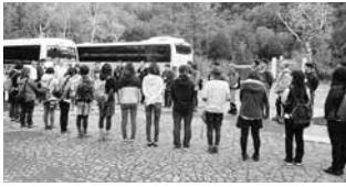
志賀高原のハイキングコン

昨年、高山村と須坂市が中心となって行ったこのイベントは、今年は山ノ内町と中野市が当番で、各社協を招集し何度も会議を重ねて、①志賀高原でハイキングと高原のホテルで交流パーティー。②北志賀高原でソラテラスからの雲海を体験した後、そば打ちと試食を兼ねホテルで交流パーティー。③シャインマスカット狩りの後、ボルダリングと交流パーティーの3つのコースを企画。各コースともアクティブ(活動的)に行動する行程が含まれることから、アクティブコンとネーミングされました。