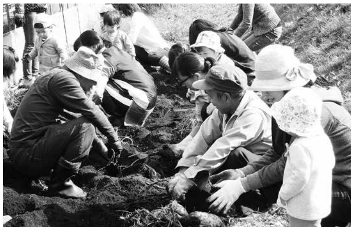
芋掘りを楽しむ親子とシルバー人材センターの皆さん