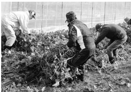
芋掘りの前に行う蔓の除去作業