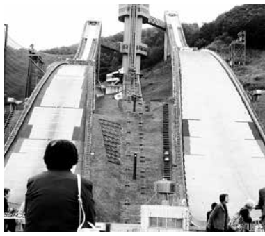
ジャンプ台の迫りに圧倒

10月4日(木)、ひとり暮らしの高齢者の方や、日中ひとり暮らしの高齢者の皆さんを対象に、「ふれあいの旅」を実施しました。今回の目的地は、北アルプスの麓、小谷村の高原にある白馬アルプスホテルです。途中、長野オリンピックで日本人選手が大活躍した「白馬ジャンプ台」を見学。施設の中に入り間近でみるジャンプ台は圧倒的なスケールでただただびつくり。20年前の感動がよみがえってきました。