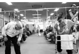
大盛り上がりのパン食い競争

10月1日(月)〜6日(土)までの6日間、デイサービスセンターでは恒例の大運動会を開催しました。