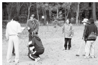
苦戦しながらも楽しむ参加者

普段マレットゴルフをされている身障協の皆さんと比べて、B型事業所利用の皆さんは、はじめは苦戦していましたが、徐々に楽しくなってきました。たようでした。