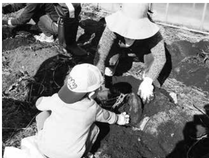
大きい芋あった～芋掘りは楽しいね