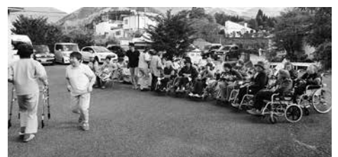
中庭に一時避難する訓練

10月31日(木)、須坂市消防署高山分署の指導により、デイサービスセンターで避難訓練を実施しました。