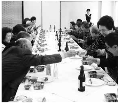
昼食を兼ねて楽しく交流

結婚式も出来る上品なホテルで、おいしい料理を食べながらの交流や、豊かな自然の中でゆったりと温泉も堪能し、深まりゆく秋を楽しむ良い一日となりました。