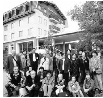
白馬アルプスホテルにて