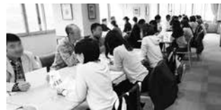
歩いた後はホテルで交流会

強い台風が接近し、天候が心配されましたが、直前まで降っていた雨も奇跡的に上がり、事前規制で連休となったソラテラスのゴンドラを除き、無事に実施することができました。山が好きで信州に住むことを希望する、東京からの女性参加者からは、「素晴らしい自然の中で山歩きが楽しめた」「楽しいイベントに参加出来て良かった」などの声が聞かれ、イベントの最後には各コース合計で104名の参加者の内、20組のカップルが誕生しました。