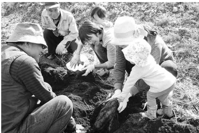
大きすぎて簡単には掘れないね～あと少しかな？