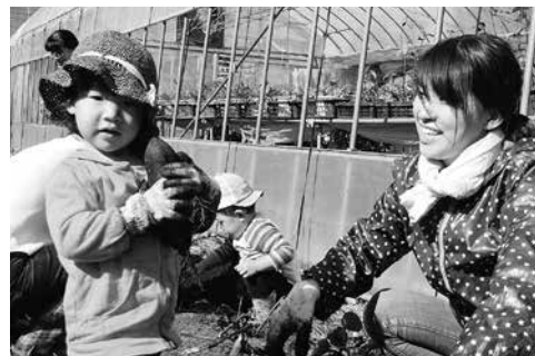
ちょうどいいお芋掘れたよ～♪

10月29日(月)、素晴らしい秋晴れの下、子育て支援センターに通う親子と、須高広域シルバー人材センター高山班の皆さんによる、世代間交流「さつま芋掘り」を開催しました。 チャオルの北側にあるフラワーセンターの敷地内に、子どもたちとシルバー人材センターの皆さんが、5月11日に植えた45本のさつま芋の苗が収穫の時期を迎え、午前10時を過ぎると続々と13組の親子が集まってきました。 シルバー人材センターの皆さんは、一足早く集合し、蔓の刈取りとビニール黒マルチを剥がす作業をして、子どもたちが来た時にすぐに芋が掘れるよう準備をして待っていました。 全員が集まった時点で開会の行事を行い、早速芋掘りが始まりました。今年、芋の成長も良く、一株から7個の芋がつながったまま掘れたり、巨大な芋が出てきたりと、そのたびにあちこちから歓声が上がりました。 深いところにあって簡単に掘れない芋は、シルバー人材の方がスコップで掘りやすくしながら、親子と共同で掘り上げるなど、ほほ笑ましい場面もあり、楽しい世代間交流となりました。 収穫したさつま芋は、親子に一袋ずつ持ち帰っていただき、また、芋蔓の一部は、子育て支援センターが、クリスマスリース作りに。茎の柔らかいところは、きんぴらや煮物、炒め物などに利用できて、しかもおいしく食べられるすぐれた食材とのことで、認識を新たにしました。