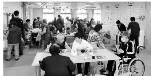
大勢詰めかけたふれあい祭り

11月11日(日)、デイサービスセンターにおいて、社協の事業や介護について知っていただくことを目的に、「第9回社協ふれあい祭り」を開催しました。