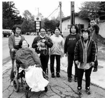
楽しい霊泉寺湖畔の散策

10月20日(土)、就労継続支援B型事業所では、事業所に通う障がい者の皆さんの秋の遠