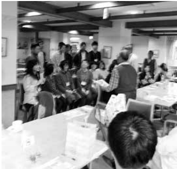
誕生したカップルを祝福