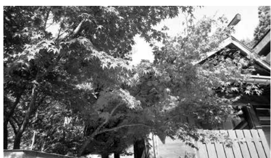
松の湯荘のみみじ

里に降りた後のちよつと淋しい牧場を眺めながら、車内に清涼な風を取り込み帰路に着きました。でも、一番きれいだったのは、観光客が「写真撮らせてください」と言うくらいに真っ赤になった「松の湯荘のみみじ」です。浴室からも眺めることができ、紅葉の期間は温泉に入りながら両方堪能することができます。写真がカラーでないのが本当に残念です。