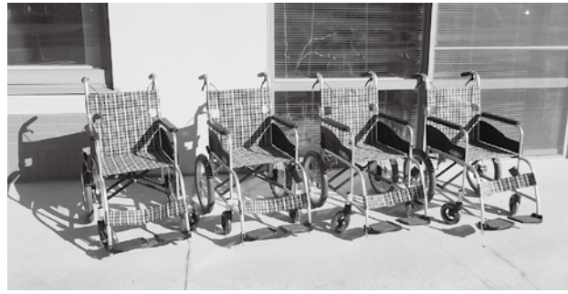
寄贈された4台の車椅子