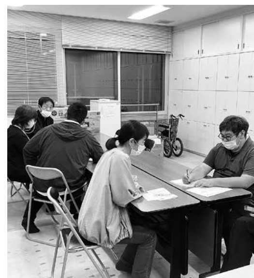
研修に取り組む職員

11月2日(木)・7日(火)・10日(金)・14日(火)・17日(金)の5日間保健福祉総合センターにおいて「虐待&身体拘束防止について」の職員研修を行いました。