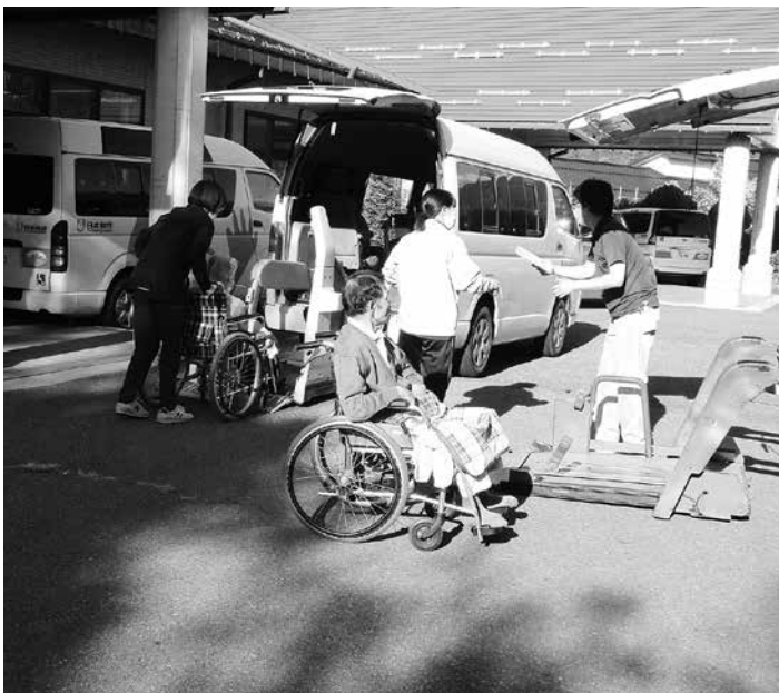
建物の外へ誘導する職員

職員同士が連携することで、円滑に避難ができ、また不測の事態への対応力が高められることを学びました。デイサービスセンターの避難訓練は、年2回実施しており、春は職員を対象にした通報・消火訓練を行い、秋には利用者の皆さんにも参加いただき実践的な訓練を行っています。