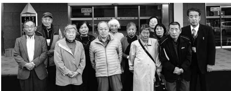
ホテルの前で記念撮影

11月17日(金)、心体などに障がいをお持ちの皆さんを対象に4年ぶりに「希望の旅」を実施しました。