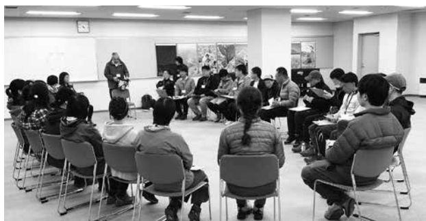
マッチング投票の様子

10月14日(土)、北信地区6町村(高山村・中野市・山ノ内町・木島平村・飯山市・野沢温泉村)社協が合同で「ii出会い秋を丸かじりコンin北信州」を開催しました。