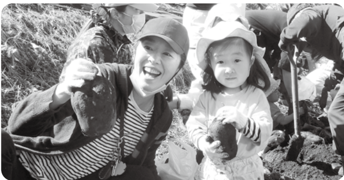
大きなお芋がとれたよ