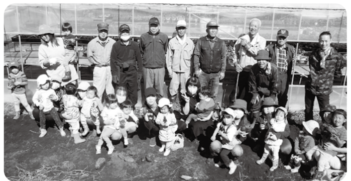
収穫後の記念撮影

10月16日(月)、フラワーセンター隣の「さつま芋畑」で、子育て支援センターを利用していている親子9組14人の皆さんと、須高広域シルバー人材センター高山班8人の皆さんによる、世代間交流「さつま芋掘り」を行いました。 当日は、シルバー人材センターの役員の皆さんが、長く伸びたさつま芋のつるを刈り取り、黒マルチをはがしたところを、子どもたちが素手で、保護者の皆さんは、移植ゴテを使ってさつま芋を掘ると、大・中・小の様々な芋がどんどん出てきました。 保護者の皆さんからは「子ども同士の間でできて楽しかった」「畑が無いので土いじりの機会がないため、親子で良い経験ができた」「さつま芋でコロッケを作りたい」などの声が聞かれました。 収穫したさつま芋は、袋いっしょに詰めて持ち帰っていただきました。