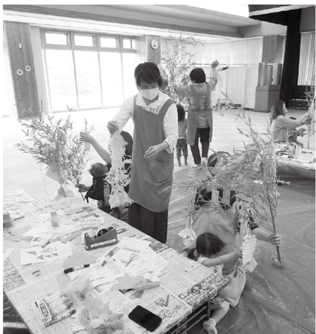
願い事を笹に飾り付け

申し込みお問い合わせ先 高山村社会福祉協議会 ☎242-11220 高山村子育て支援センター ☎242-2660