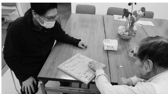
将棋を楽しむ利用者

お風呂から上がると各々の時間となります。食事の準備を職員としたり、脳トシや将棋など楽しんで過ごすことができます。