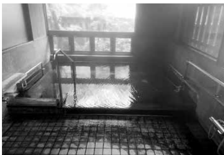
源泉100%のかけ流し温泉

午前10時45分から入浴の時間になります。源泉100%のかけ流し温泉ですので、利用者の皆さんからは、身体のみまで温まると評判です。