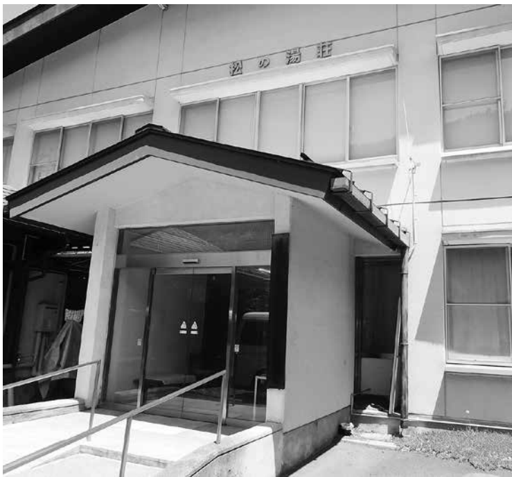
松の湯倶楽部が使用している松の湯荘

午前8時40分頃に送迎車が社協を出発し、利用者宅へお迎えに伺います。 午前9時30分頃に送迎車は松の湯荘に到着し、利用者の皆さんの体調確認、血圧測定を行います。 午前10時にYOU游ランドのインストラクターと一緒に手ぬぐいやボールを使って機能訓練を行います。