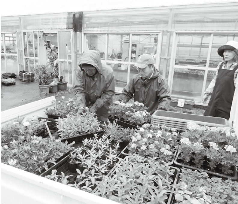
花いっぱい運動のスタートとなる花苗の配布

5月19日(金)、フラワーセンターにおいて、「高山村花いっぱい運動」のスタートとなる春季の花苗(マリィゴールド・ガザニア・けいと等)約3,600本を配布しました。