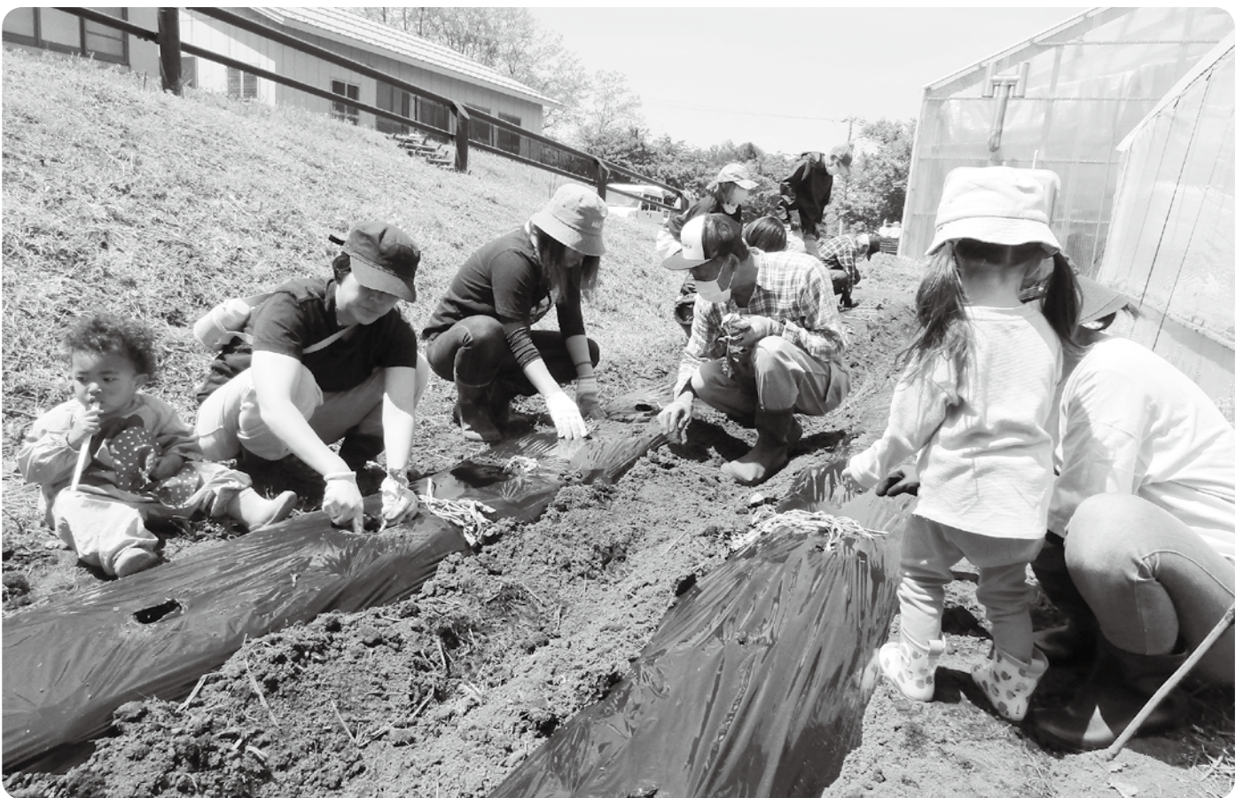
さつま芋の苗植えを行う親子とシルバー人材センターの皆さん

5月12日(金)フラワーセンターの空きスペースの畑を利用して、子育て支援センターに通う親子8組19人の皆さんと、須高広域シルバー人材センター高山班6人の皆さんによる、世代間交流「さつま芋の苗植え」を行いました。シルバー人材センターの役員さんが、事前に堆肥や肥料を施したうえで、畝立てし、黒マルチを掛けていただいたところに、50本のさつま芋の苗を1本ずつ丁寧に植えていきました。参加した保護者の皆さんからは、「子どもは普段土に触れることがないので、新鮮で楽しそうでした」、「娘は人見知りするので心配でしたが、シルバー人材センターの方に親しく接してもらいとても喜んでいました」、「初めての参加でしたが、今から秋の収穫が楽しみです！」などの声が聞かれました。