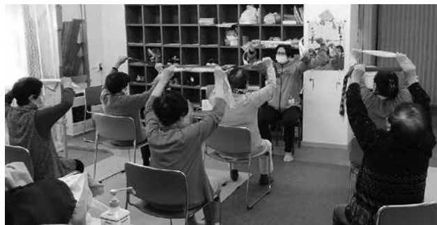
手ぬぐいを使っての機能訓練