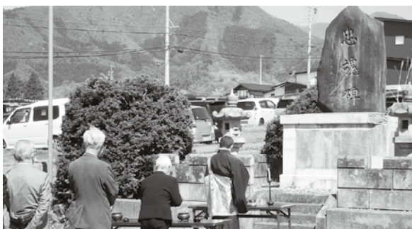
忠魂碑前で行われた慰霊法要

4月19日(火)、高山中学校体育館駐車場入り口にある「忠魂碑」前で、正安寺ご住職により戦没者慰霊法要を執り行っていたきました。正安寺ご住職の読経が始まると、最初に社協会長、続いて遺族会役員、遺族会の皆さんの順にお焼香を行いました。戦争で犠牲になられた方々のご冥福と、戦争の惨禍を二度と繰り返さない世の中になる事を祈願しました。