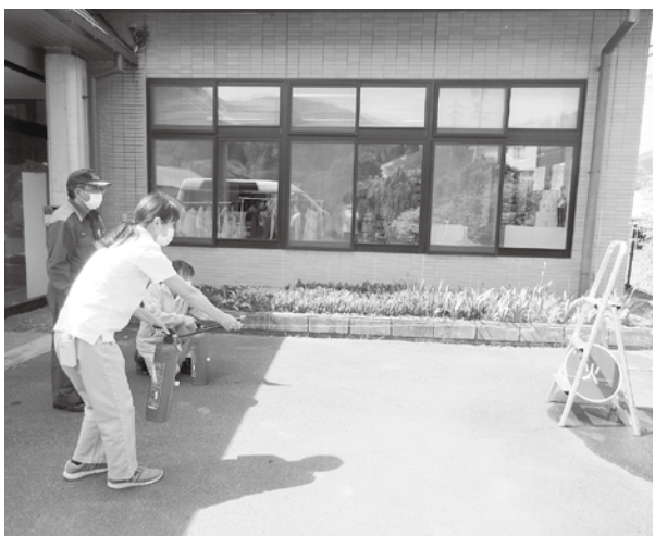
的に向けての消火訓練

を第一に考えて避難すること。また、日頃からハザードマップで避難場所を確認しておくことや、自宅でも災害に備えて水や食料に加え、携帯トイレを準備しておくこと」などの大切さを指導していただきました。デイサービスセンターの消火訓練は、年2回実施しており、春は職員を対象にした通報・消火訓練を行い、秋には利用者の皆さんにも参加いただき実践的な避難訓練を行っています。