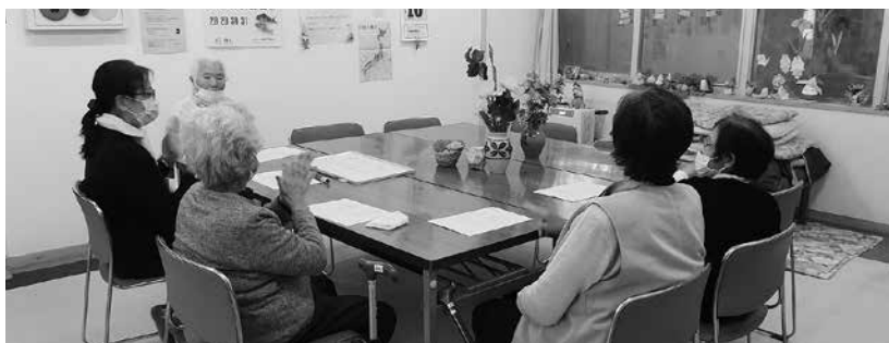
ゲームを楽しむ利用者の皆さん

正午に口腔体操を行った後、昼食の時間になります。昼食は、利用者の皆さんと一緒に作った料理で会食を行います。 午後1時から2時までの1時間は、身体を休めるための休憩の時間となります。休憩の後は、おやつを食べ、みんなでゲームをしています。 午後3時過ぎには送迎車に乗って帰宅します。