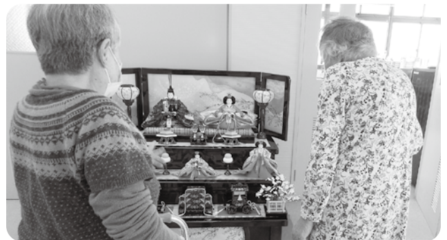
雛飾りを前に「きれいなお顔だね」

デイサービスセンターでは、3月1日から4月3日まで桃の節句に合わせて「人形工房 讀久長野本店様」のご厚意により、事務所入口に雛人形が飾られました。 歩行練習で事務所入口を通る利用者の皆さんは足を止めて、雛飾りの前で、「きれいなお顔だよね」「立派だね」「最近のおひな様はこうなんだね」「戦時中のおひな様は、物がない時代のため、お顔は、ふすま粉で作られていたから、ねずみにかじられたりしたんだよ、それに三人官女の身体は棒に衣装を着けただけで、雛段に立てかける物もあつたんだよ」などの話をされていました。 また、利用者のお孫さんからご寄付いただいたおひな様(舞姫)も飾り、この時期だけのおやつ(さくら餅)を食べながら季節を感じていただきました。