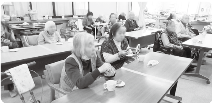
さくら餅を味わう利用者の皆さん