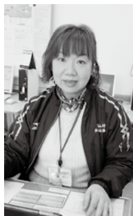
長谷部ケアマネジャー

「ケアマネジャー」という名前は、聞いたことがあるけど、いったいどんな仕事をしているのか分からない方が多くいらっしゃるのではないのでしょうか？