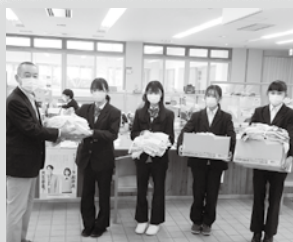
中学生の皆さんから タオルの寄付