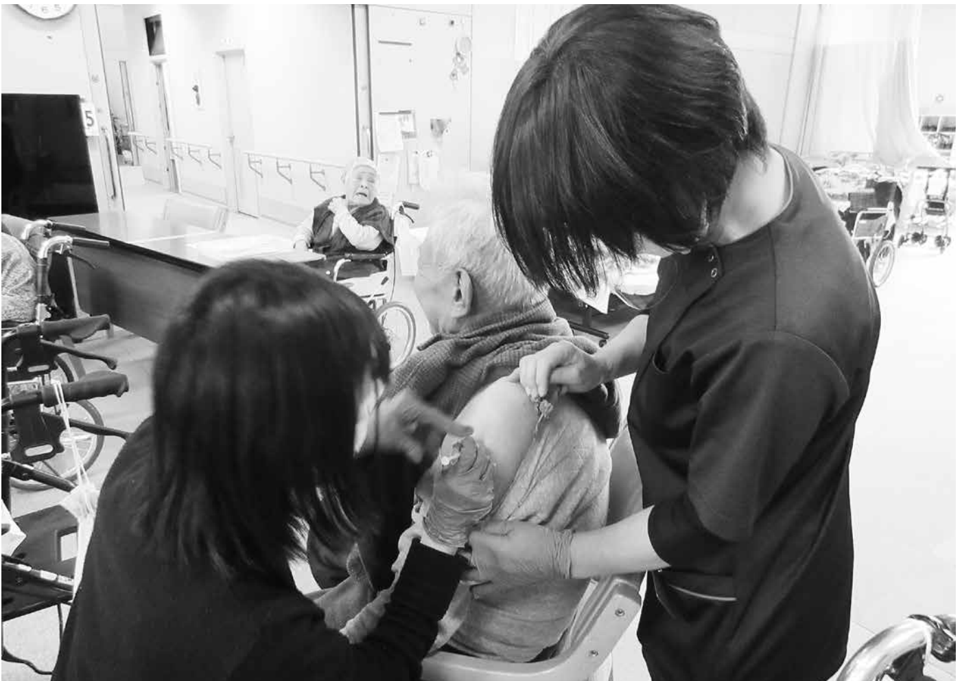
デイサービスセンターで3回目のワクチン接種を受けるご利用者の皆さん

新型コロナウイルス感染症は、国内で感染が確認されてから2年余りが経過しましたが、今年に入ってから是非常に感染力が強いオミクロン株となって瞬く間に蔓延し、高齢者や若い方への感染が拡大しています。こうしたことから、県や村の新型コロナウイルス感染症対策本部からは、改めて村民の皆さまに対して新しい生活様式の徹底をはじめ、手洗いやマスクの着用など基本的な感染症対策が呼びかけられています。 そのような中で、高齢者の皆さんが安心して日常生活が送れるよう、デイサービスセンターでは、去る2月14日から17日までの間において、利用されている皆さんの第3回目のワクチン接種を行っていただきました。