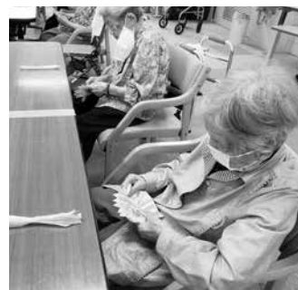
菊の花作りに取り組む利用者の皆さん

利用者の皆さんは、お花紙で菊やコスモスの花作りが上手にできた人や、中々上手に出来ずに苦労してい