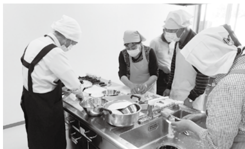
グループ毎に調理開始