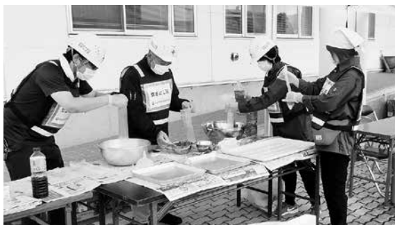
米と具の袋詰め作業

炊き出し給食訓練は、熱に強いハイゼックス(強化ポリエチレンの袋)に無洗米・炊き込みご飯の素・だし汁を加え、沸騰したお湯の中で35分間煮て仕上げます。ハイゼックスを使用し