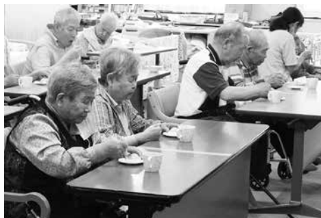
和菓子を味わう利用者の皆さん

利用者の皆さんからは「ちょっとしたメニューなどの工夫でも楽しい気分になる」「普段飲めないし、食べられないからうれしかった」などの喜びの声がかれました。