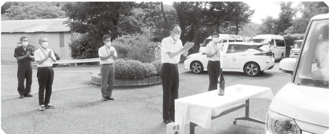
福祉車両安全祈願式